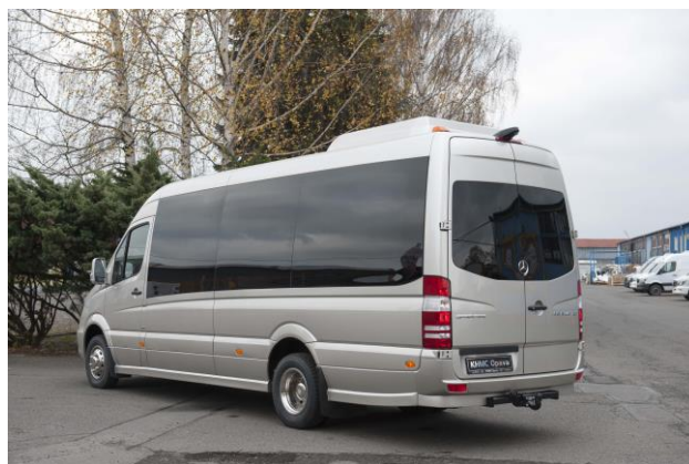
Fotografie jsou pouze ilustrační, mohou být zobrazeny příplatkové obce, které nejsou součástí dané nabídky